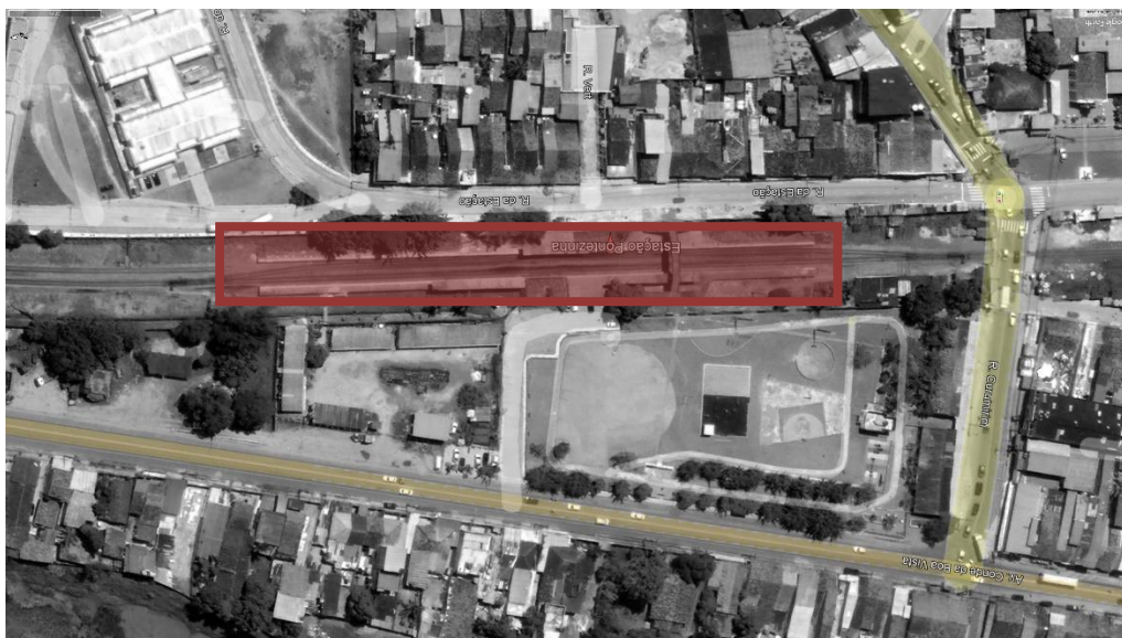
FIGURA 1 – ESTAÇÃO PONTEZINHA